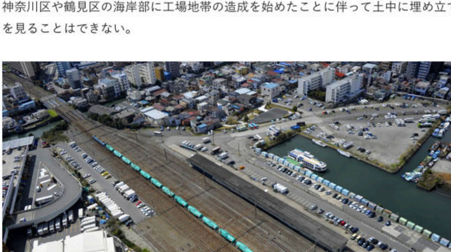
地下に台場が残されている

かつて台場があった地域は、現在のJR貨物線の東高島駅とほぼ等しい。台場が置かれた海は浅くて、全面の石垣は海底から9メートルの高さまで積み上げられており、総面積は台場の本体部分だけで2ヘクタールを超えていた。台場は1899年に外国人居留地の廃止に伴い撤廃、その後大正時代に横浜市が現在の神奈川区や鶴見区の海岸部に工場地帯の造成を始めたことに伴って土中に埋め立てられ、現在、その様相を見ることはできない。