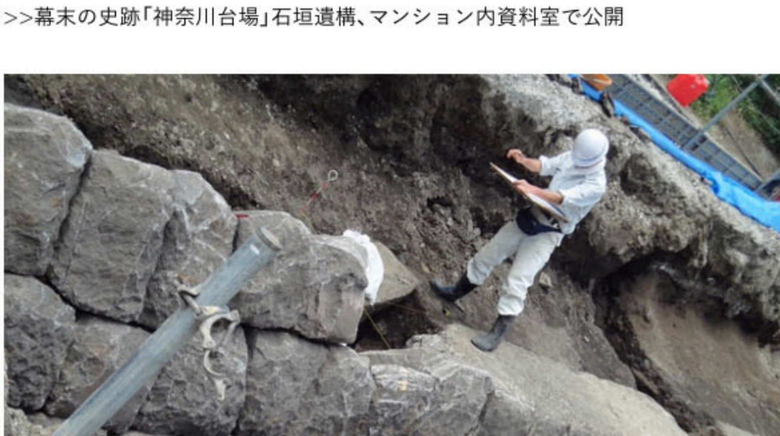
神奈川台場石積みの調査